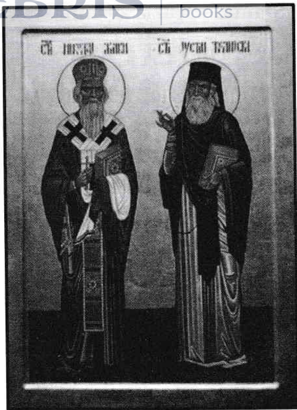
Sfântul Nicolae Velimirovici împreună cu Sfântul Justin Popovici, căruia i-a și dedicat acest acatist